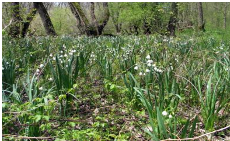
Снимка: Блатно кокиче (/ Leucojum aestivum L. ) в защитена местност „Иванов гьол”

Блатното кокиче е вид поставен под специален режим на опазване и регулирано ползване от естествените находища, съгласно ЗБР. Блатното кокиче съдържа алкалоида галантамин, използван за лечение на различни заболявания на нервната система като детски паралич, парези и др. Ползването на листовъблена маса се осъществява със съгласие на собствениците и с разрешение на МОСВ в зависимост от състоянието на популациите и ресурсните им възможности.