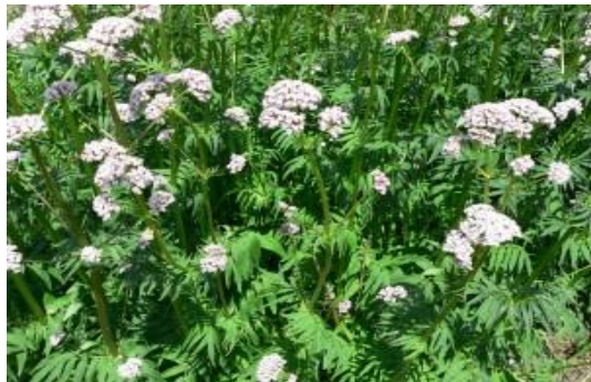
Дулянка / Valeriana officinalis L. /

След разпределяне на максимално допустимите количества билки от лечебни растения, поставени под специален режим на ползване, всички членове на комисиите и включените в разпределението билкозаготвители получиха заповед на директора на РИОСВ - Стара Загора за разпределените количества през 2012 г. РИОСВ съществяваше и контрол на издадените от Общини и Държавни горски стопанства позволителни за ползване на билки от лечебни растения. При извършените проверки не са установени нарушения по ЗЛР.